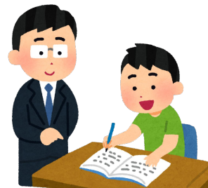
教師 多くのホワイトカラー