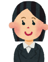
プログラマー 秘書